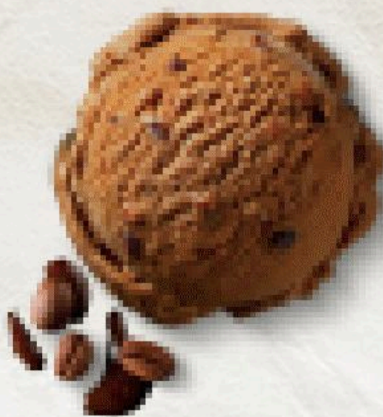
Mocca * enthält Haselnuss